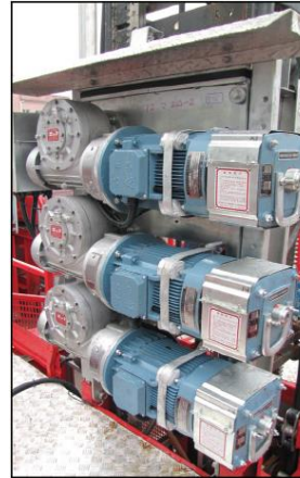
Unidad de motores