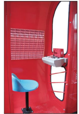
Cabina del Operador